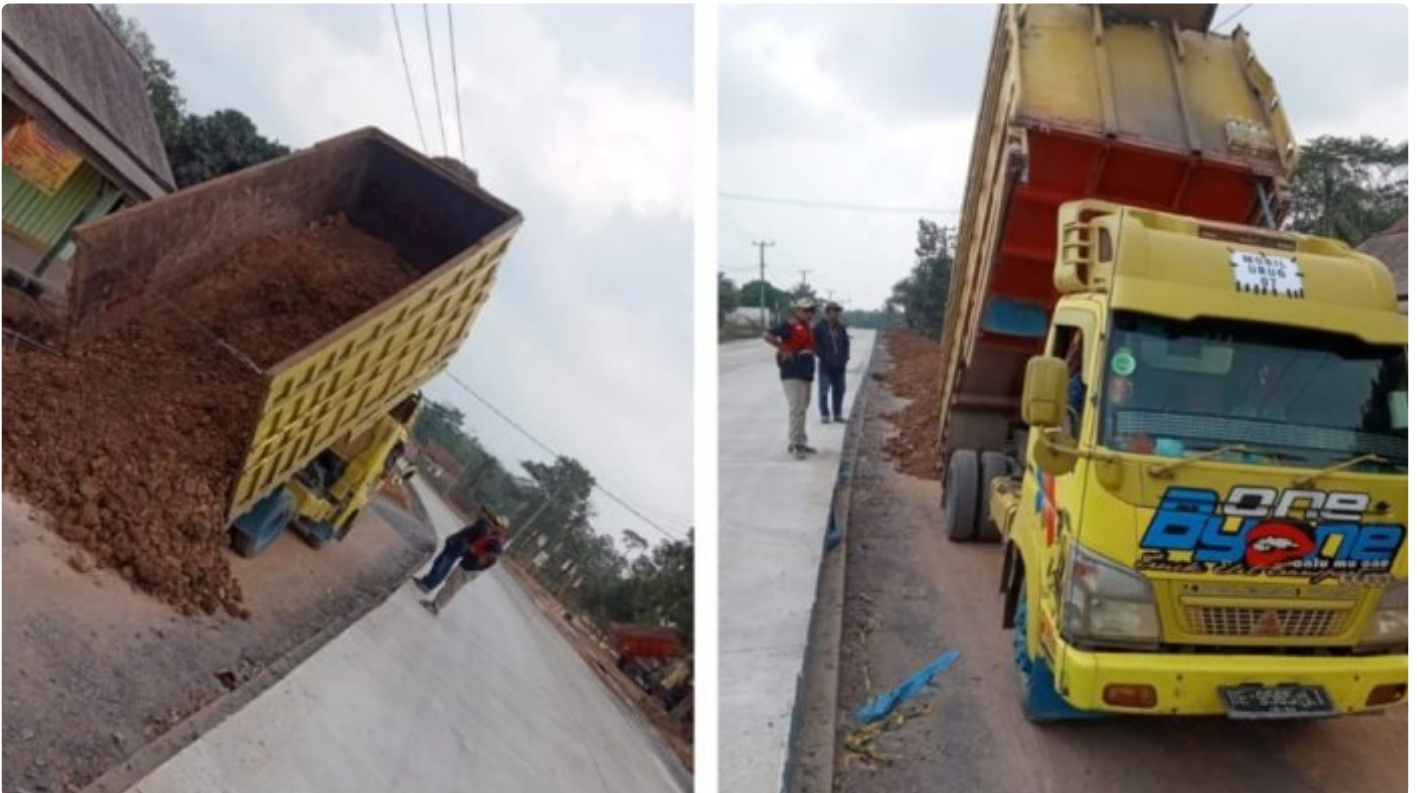
Mobil Pengangkut Tanah Galian C